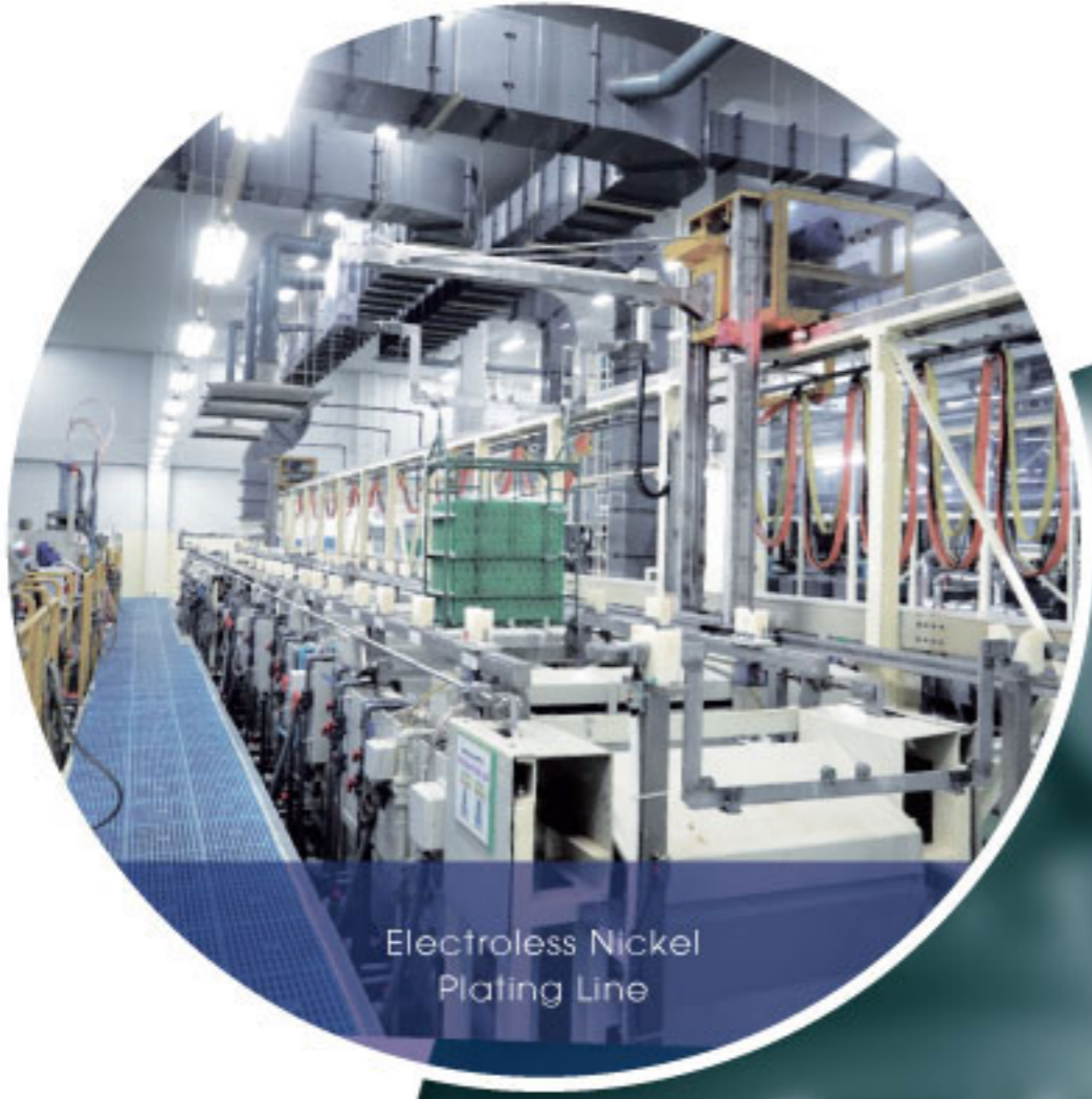
Electroless Nickel Plating Line