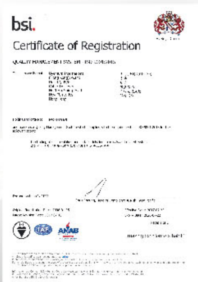
Quality Management ISO 9001:2015