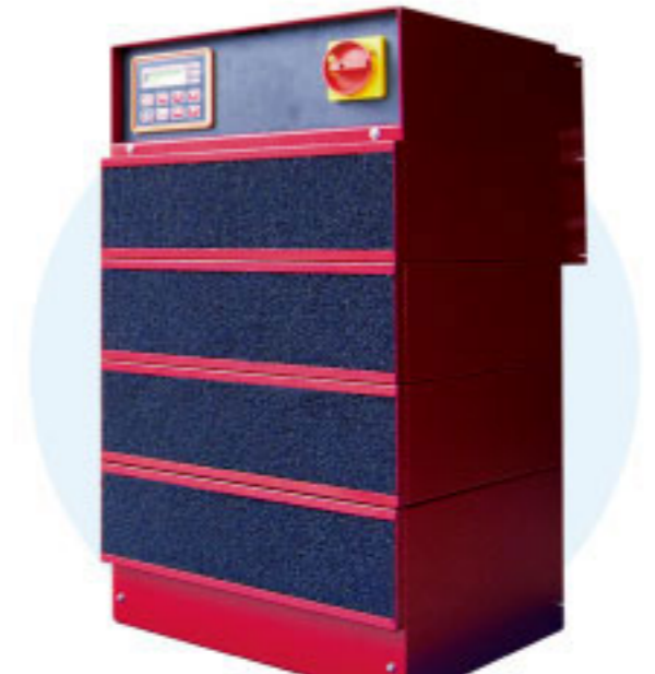
硬质阳极PPR正反脉冲整流器

Power supply equipments are major equipment to complete electroplating processing combination electroplate sink. Uyemura supplies THE HIGH FREQUENCY SWITCHING PLATING RECTIFIERS power supply equipment as well as products manufactured by Japan, Europe and China.