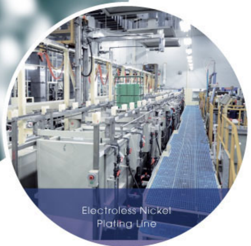
Electroless Nickel Plating Line

This carrier operates along the back side of the process tank. This allows for low overhead clearance, modularized construction, and open access for easier maintenance. Since the mechanics of the carrier are below the tank rim level, the process solutions are protected from contamination generated by the drive system.