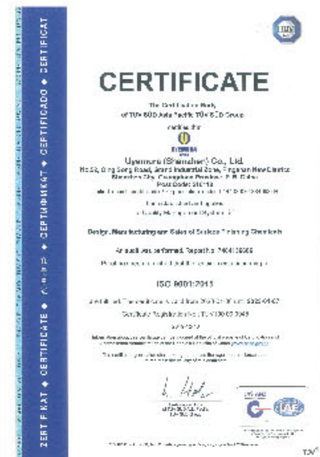
Environmental Management ISO 9001:2015